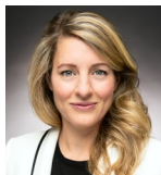
Mélanie Joly Députée - Member of Parliament